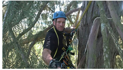
Auf dem höchsten Mammutbaum Deutschlands