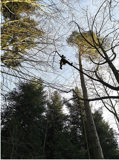
Aussenastklettern auf gewöhnlicher Buche