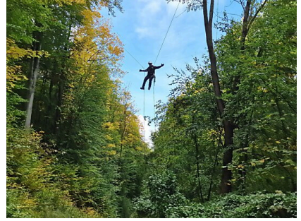
Seilbrücke für einen "schwebenden" Cache