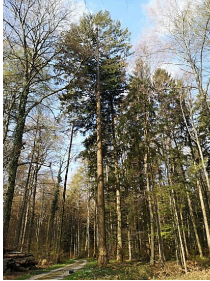
Douglasie (ca. 46 Meter) im Wald der Bürgergemeinde Salenstein (Kletterer im Baumwipfel)