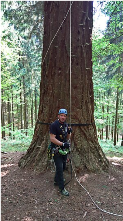
Am höchsten Mammutbaum Deutschlands