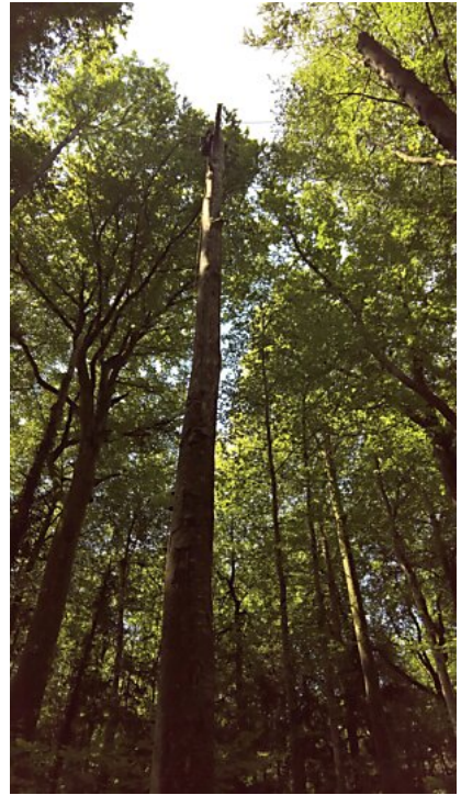
Seilbrücke auf toten Stamm